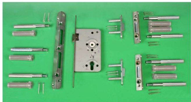
Beispiel eines (Tür-)Nachrüstsatzes für Holztüren

Auch Türen können mit einem Sicherungssystem im Falz nachgerüstet werden. Zusätzlich ist ein einbruchhemmender Schutz-beschlag und Profilzylinder erforderlich.