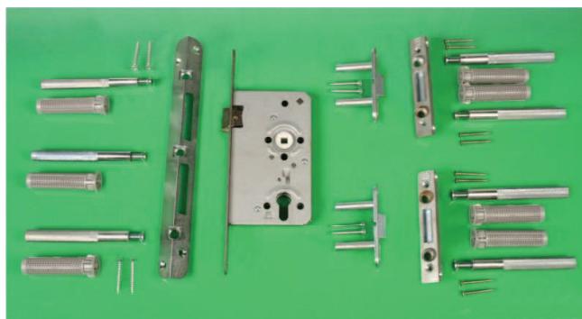
Beispiel eines (Tür-)Nachrüstsatzes

Auch (Holz-) Türen können mit einem Sicherungssystem im Falz nachgerüstet werden. Zusätzlich ist ein einbruchhemmender Schutzbeschlag und Profilzylinder erforderlich.